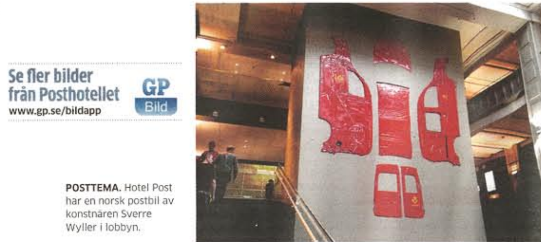
POSTTEMA. Hotel Post har en norsk postbil av konstnären Sverre Wyller i lobbyn.

Se fler bilder från Posthotellet www.gp.se/bildapp