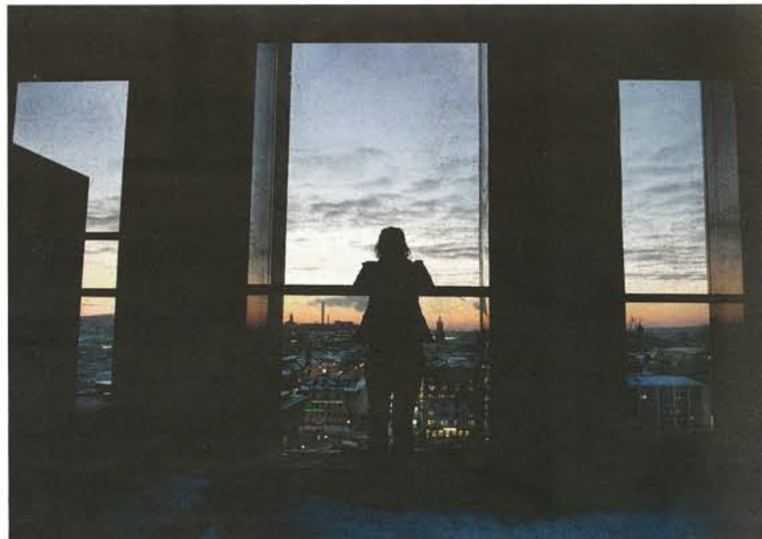
CENTRUM I SKYMMNINGEN. Utsikt från toppen av nybyggda Clarion Hotel Post.