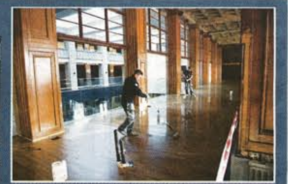
Restauranggolvet får sluttäckeringen.