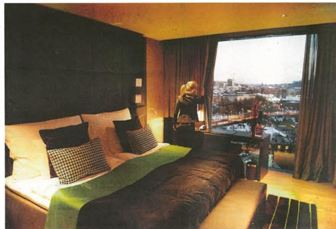
ETT LITE LYXIGARE RUM. Hotel Posts Juliusstift.